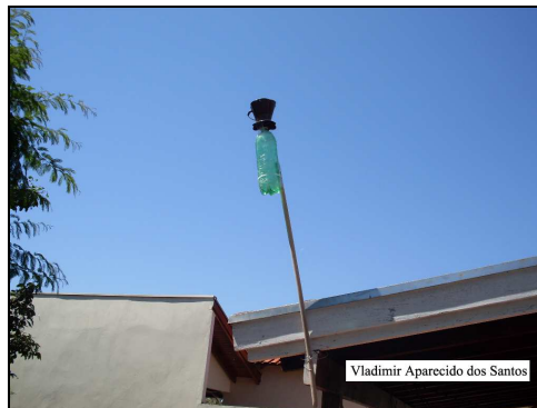
Figura 2: Modelo de instalação e posicionamento do equipamento.

Durante o prazo de medição, foram feitas rotineiras observações para certificação da normalidade do processo e assim evitar as perdas das amostras. Ao final do período de coleta do material particulado, os coadores foram etiquetados e desconectados das garrafas, as quais foram devidamente fechadas com tampas, para a refiltragem da água armazenada; foram também etiquetadas com os nomes dos bairros ao qual pertencem, para não ocorrer confusão e serem trocados; a água que ficou armazenada foi medida com um para daí obter com precisão o quanto choveu em cada local. Os filtros foram armazenados em sacos plásticos e devidamente etiquetados com o nome de seus respectivos bairros para serem novamente pesados após estarem totalmente secos.