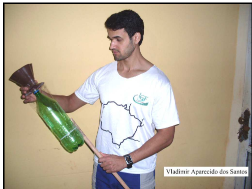
Figura 1: 1º Coletor de material particulado, construído para teste.

trabalho foi o de no mínimo 1,50 metros de altura do chão à base inferior do cabo, com o intuito de captar a poluição que estivesse efetivamente suspensa no ar, além disso, o equipamento não poderia ser posicionado embaixo de árvores por conta das folhas que proveniente caem na estação de inverno (Figura 2).