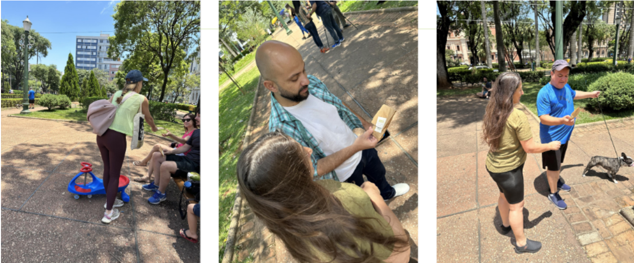
Figura 10 – Entrega dos kits com sementes de frutíferas

proporcionam valiosas oportunidades de aprendizagem para os estudantes. Esse tipo de trabalho permite que eles expandam seus conhecimentos para além das fronteiras acadêmicas, atuando no espaço urbano e interagindo diretamente com a comunidade. Os estudantes aprendem a considerar o impacto emocional de seus trabalhos no público, explorando como a comunicação visual pode influenciar comportamentos e atitudes.