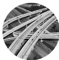
Figura 1 – Síntese do conceito de marca do projeto Pomar Urbano

O primeiro passo foi compreender o enunciado para o desenvolvimento da identidade visual do projeto Pomar Urbano, conforme resumido no Quadro 1. Esse resumo destacou os principais objetivos e diretrizes que guiaram o desenvolvimento do projeto, que incluiu a elaboração do briefing, a pesquisa de público-alvo e similares, o desenvolvimento do conceito, a geração de alternativas, a seleção da melhor alternativa, a criação da marca e dos demais elementos visuais, a aplicação da marca em diversos materiais, a criação do manual de identidade visual e a apresentação final do projeto. Com base nessas orientações, os estudantes iniciaram sua jornada de desenvolvimento do projeto de identidade visual do Pomar Urbano.