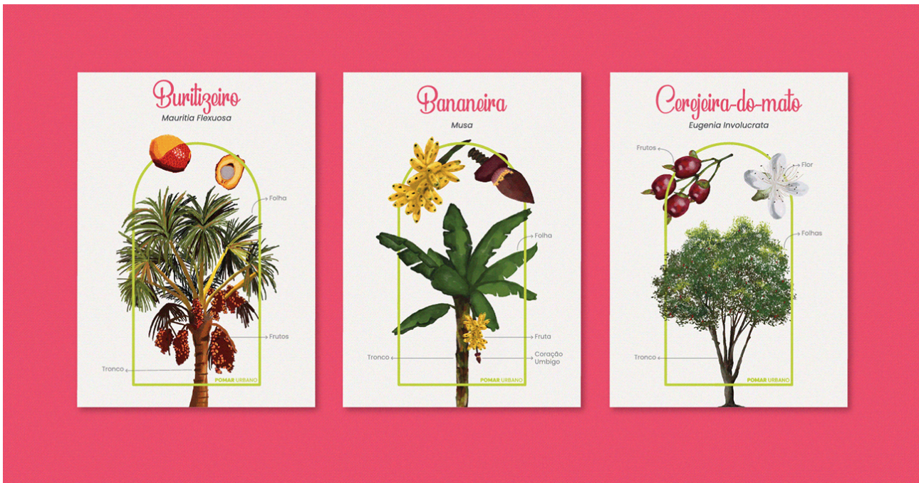
Figura 5 – Cartões postais do projeto Pomar Urbano