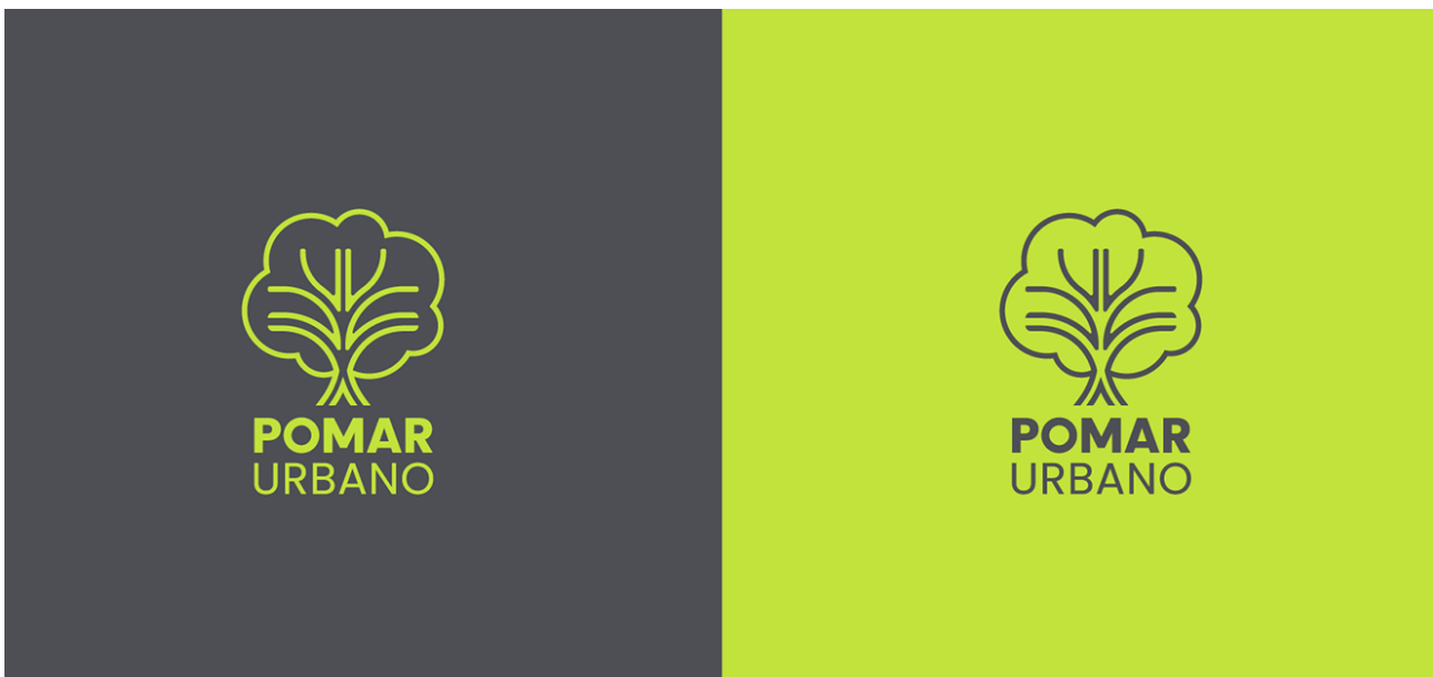
Figura 2 – Marca finalizada do projeto Pomar Urbano

natureza. A partir desse conceito, desenhou-se um símbolo que representa tanto as vias urbanas quanto a estrutura de uma árvore, criando uma imagem que simboliza a necessidade urgente de coexistência desses "dois mundos". O logotipo, por sua vez, foi construído utilizando letras geométricas, que empregam formas básicas e proporções matemáticas para criar um conjunto tipográfico equilibrado e funcional. Nesse processo foram priorizadas a simplicidade, a clareza e a legibilidade, essenciais para uma marca que deve ser reconhecida e compreendida facilmente. Ao combinar esses elementos, logotipo e símbolo trabalham juntos para comunicar a missão do projeto e valorizar a biodiversidade no ambiente urbano.