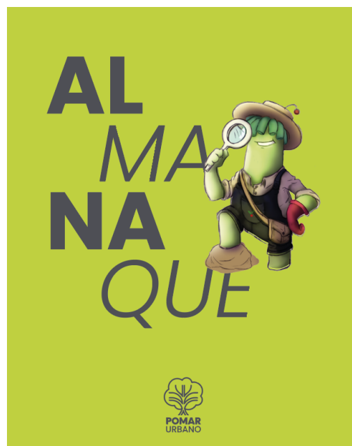
Figura 7 – Capa do Almanaque do projeto Pomar Urbano

O almanaque , por sua vez, foi desenvolvido com o objetivo de criar jogos de passatempo relacionados ao projeto Pomar Urbano, proporcionando uma maneira lúdica e interativa de informar o público sobre a importância da biodiversidade urbana. Já o livro infanto-juvenil tem como propósito sensibilizar as crianças sobre a importância da biodiversidade por meio de narrativas e ilustrações, tornando o aprendizado mais envolvente e acessível para o público jovem. E o folder , é um material de divulgação esquemático que informa de maneira objetiva como participar do projeto, facilitando o entendimento e a adesão da comunidade.