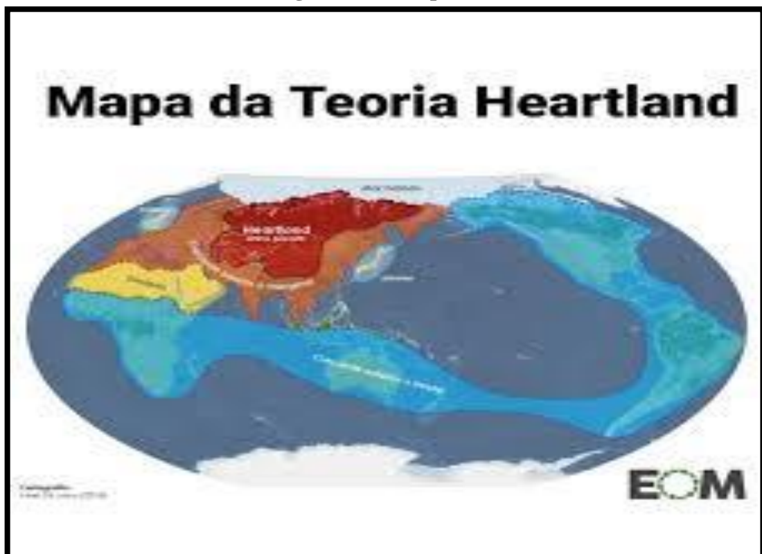
Figura 2 – Área pivô do mundo