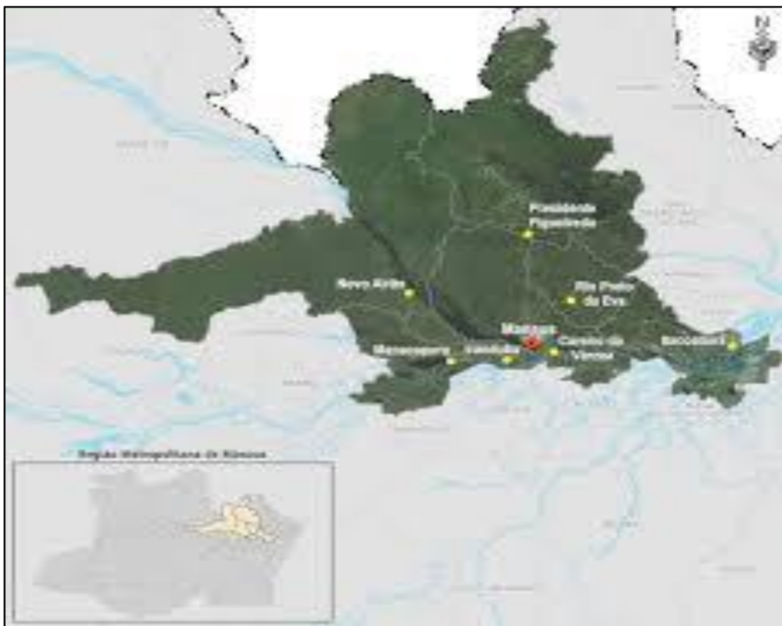
FIGURA: 01- REGIÃO METROPOLITANA DE MANAUS