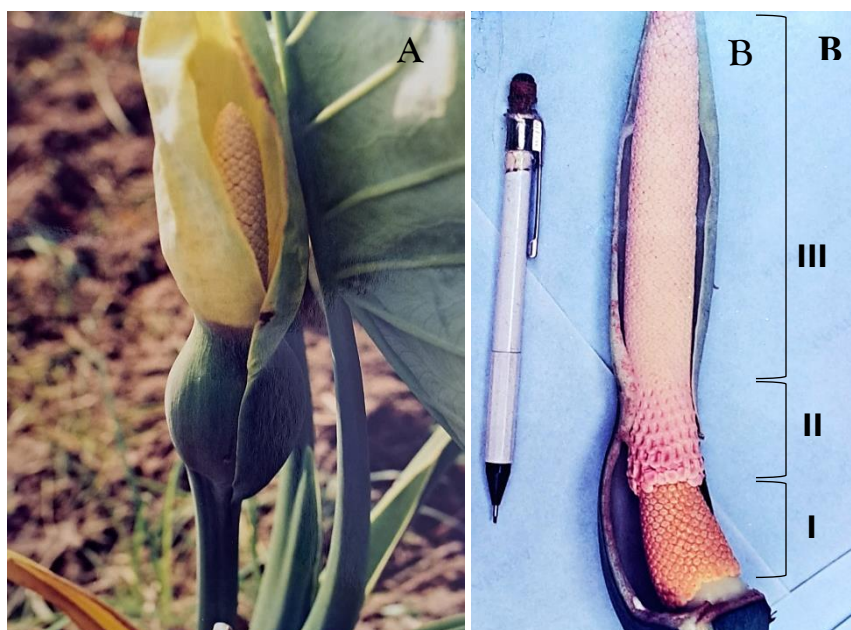
Figura 2. Detalhe da inflorescência da espécie Xanthosoma taioba , coleção do INPA. Manaus-AM. (A) Espádice ereta protegida por uma espata membranácea; (B) Porção feminina coniforme de coloração amarela brilhante [I], porção masculina infértil de coloração rosada [II] e porção masculina fértil de coloração creme [III].