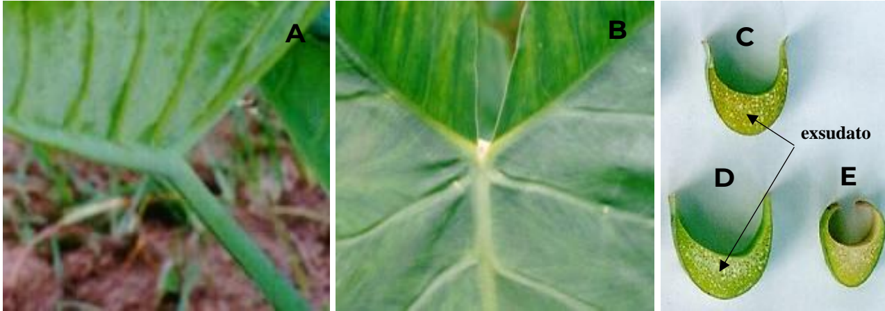
Figura 1. Folha verde fosco mais claro abaxialmente (A); Articulação do pecíolo com o limbo não-peltado e tipo de união com cinco nervuras (B) e, formatos da margem da bainha do tipo convoluta para fora (C), ereta (D) e fechada (E); exsudato após corte pecíolo de Xanthosoma spp.

A disposição das folhas se caracterizou por ser no sentido horário para os acessos (IH2209; IH1264; IH1267; IH2210; IH2208; IH1262; IH2206; IH2212) e anti-horário para os demais. A orientação do limbo mostrou-se,