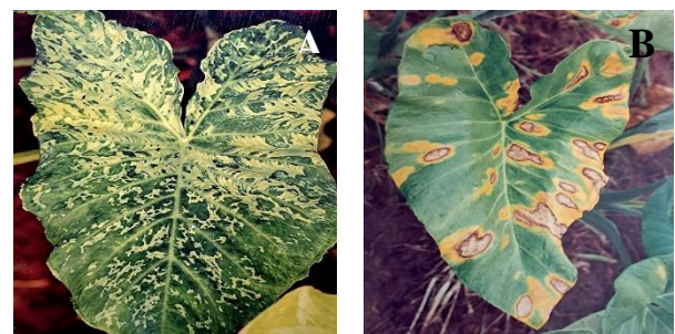
Figura 4. Sintomas do Dasheen Mosaic Virus (DMV) em toda a lâmina foliar de Xanthosoma taioba (A); Sintomas da doença causada pelo fungo Phoma spp. na lâmina foliar de X. taioba .

retardamento no crescimento da planta e redução na produção de tubérculos (CARMICHAEL et al., 2008).